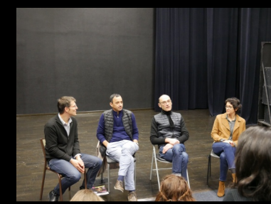
Rencontres avec les équipes