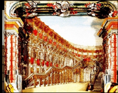
Histoire du théâtre