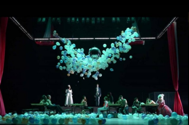
Analyse de spectacles