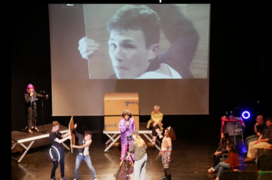
Mise en scène