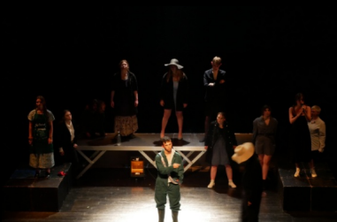
Projets de création